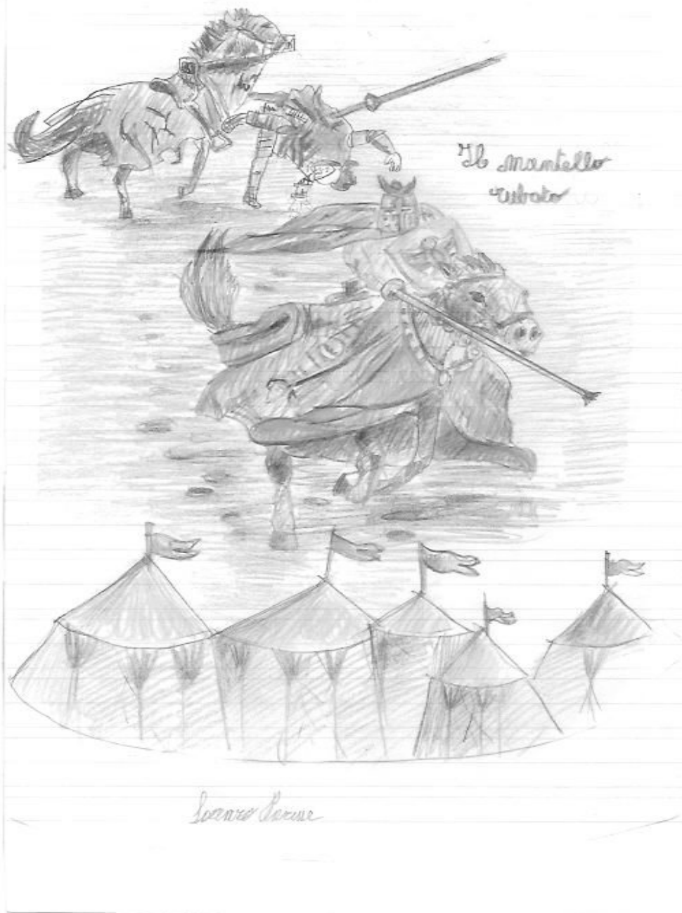
Illustrazione di Lorenzo Parisse